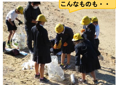
こんなものも・・・